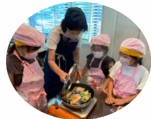
青空キッチン氷見校にて (かむかむSmile)