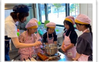
青空キッチン氷見校にて (かむかむSmile)